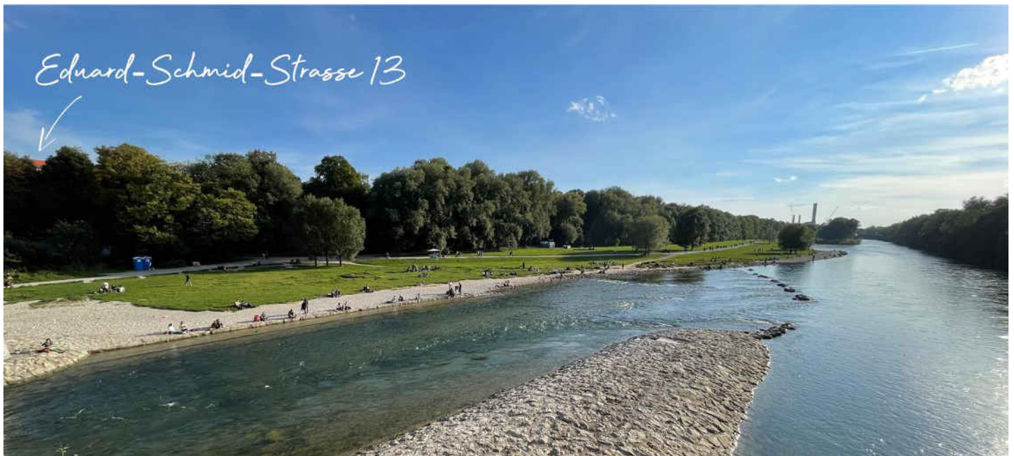
Blick Richtung Süden