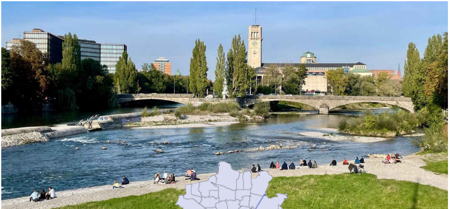
Blick Richtung Norden